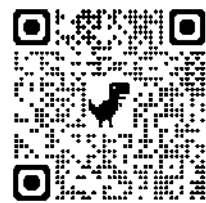
町会のホームページ

【上平間第一町内会 ホームページ】 町内会のイベント情報や、これまでの防災まちづくりNEWSを掲載しています。右のQRコードからアクセスできます。