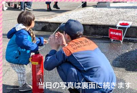
当日の写真は裏面に続きます

2月16日(日)に中原消防署と川崎市の協力の元、町内会主催で防災フェアを実施しました。穏やかなお天気に恵まれ、小さなお子さんからお年寄りまでの195名の方々にお越しいただきました。 防災を楽しく学べる ように、9つのブースをシールラリー形式で回れるように工夫しました。本ニュースの裏面で各ブースの様子をご紹介します！